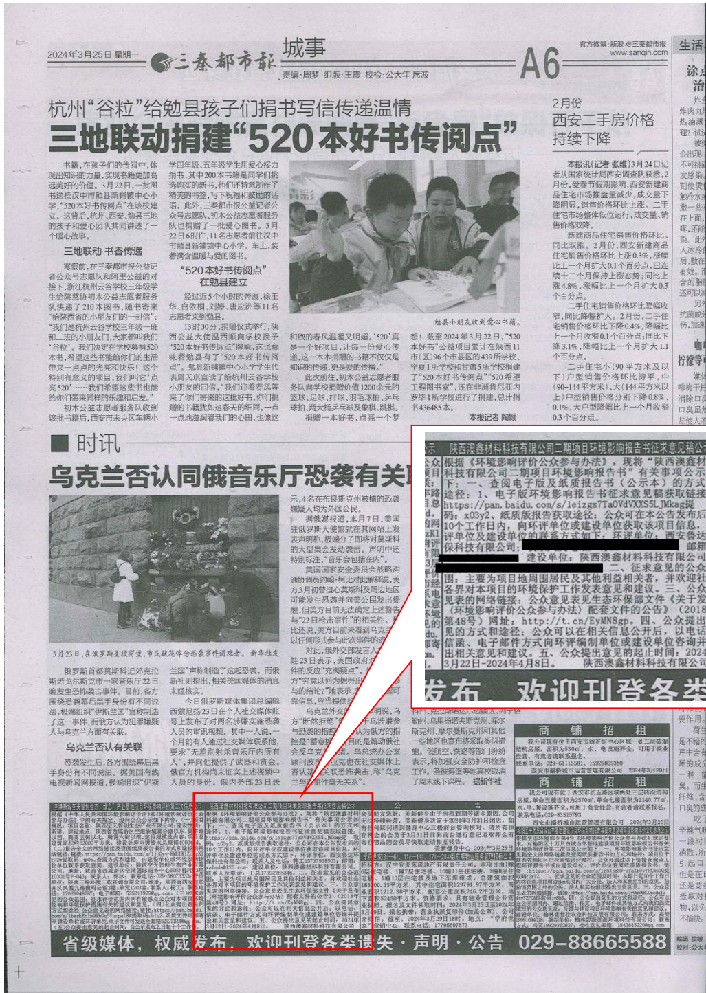
图5 征求意见稿第一次报纸公示截图（2024年3月25日）

本次报纸公示选取媒体为《三秦都市报》（《三秦都市报》是陕西发展速度较快、综合影响力较大的报刊，属建设单位所在地易于接触的媒体），公示日期分别为2024年3月25日和2024年3月28日，均在征求意见的10个工作日内，公示载体和日期均符合《环境影响评价公众参与办法》相关要求。报纸公示情况见图5、图6。