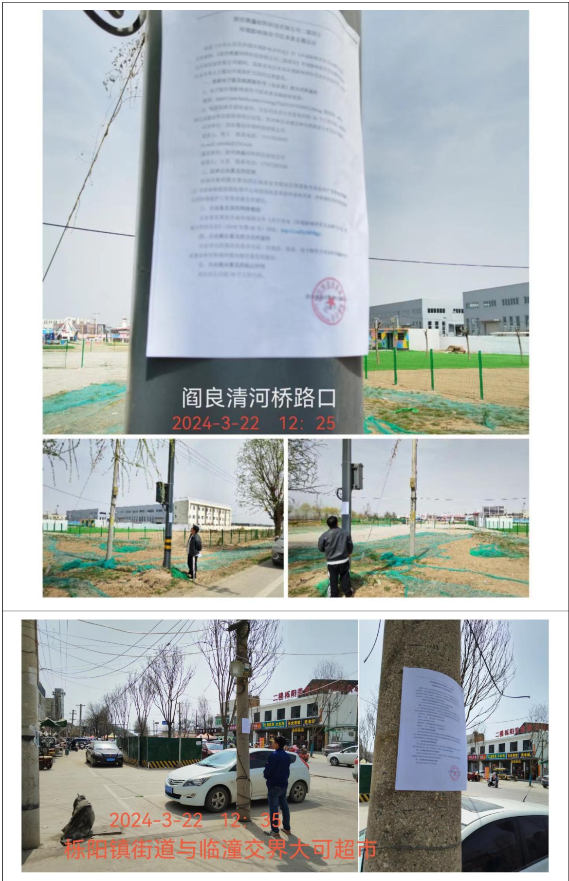
图7 征求意见稿张贴公示照片