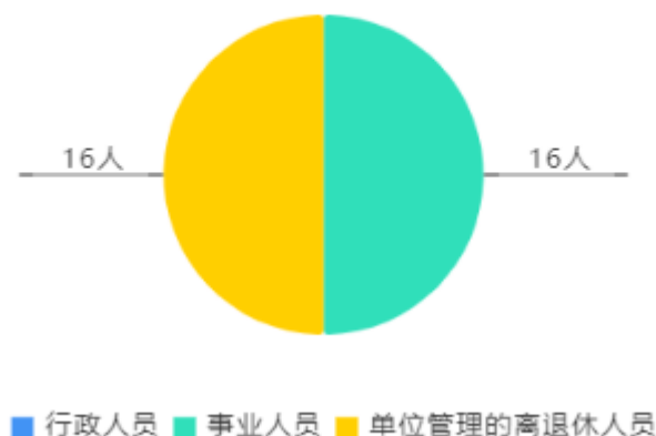
人员情况构成饼图

截止上年底，本单位人员编制15人，其中行政编制0人，事业编制15人；实有人员16人，其中行政0人，事业16人。单位管理的离退休人员16人。