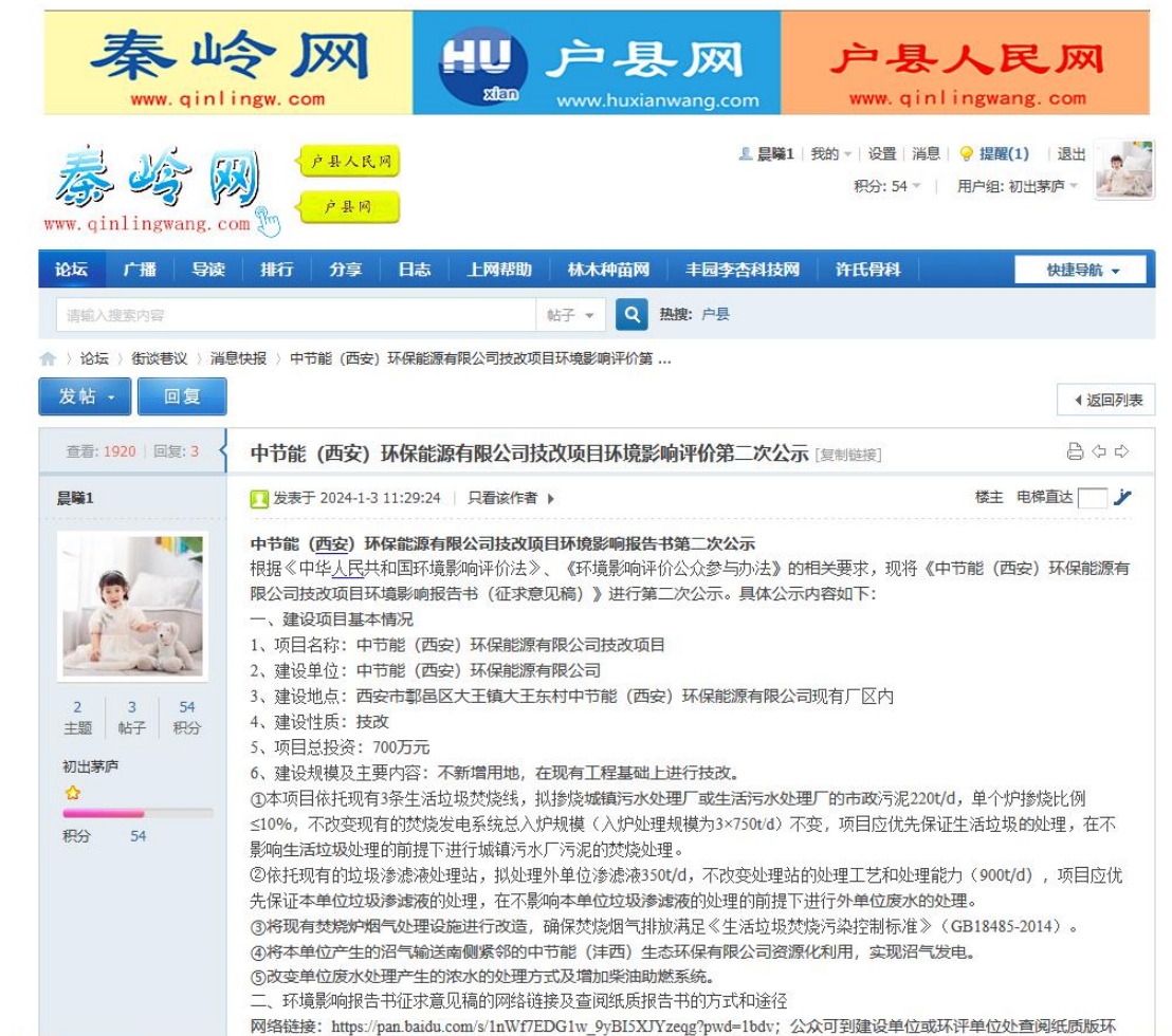
图 3-1 第二次网上公示截图

2024年1月3日，我公司在秦岭网对项目环境影响评价信息进行了公示。第二次网上公示截图见图3-1。