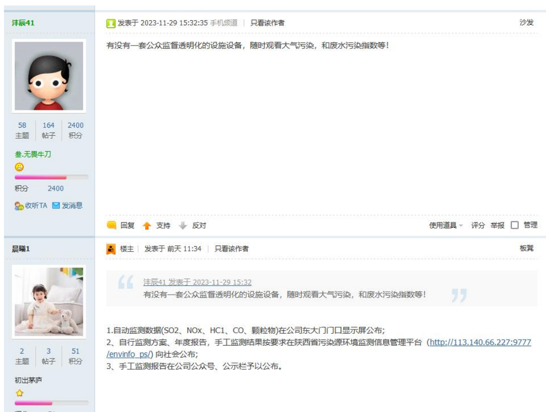
图 2-1 第一次网上公示期间的公众参与意见