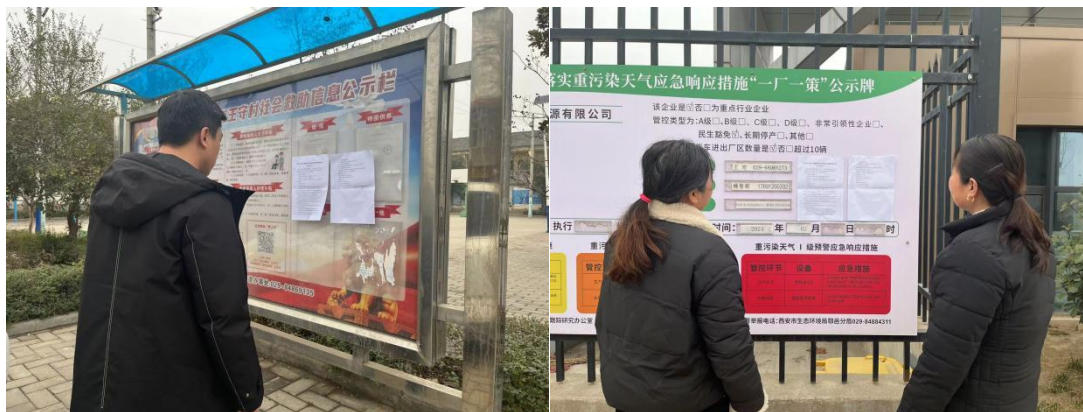
图 3-4 1月5日张贴公示