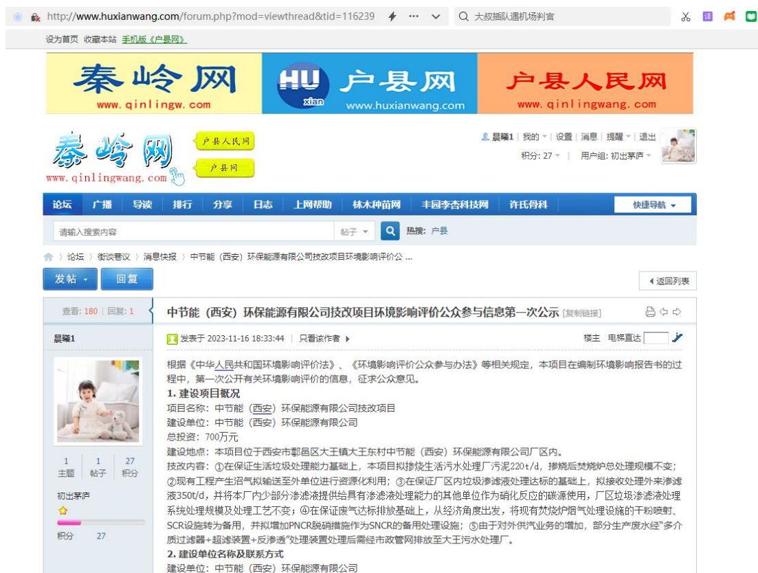
图 2-1 第一次网上公示截图