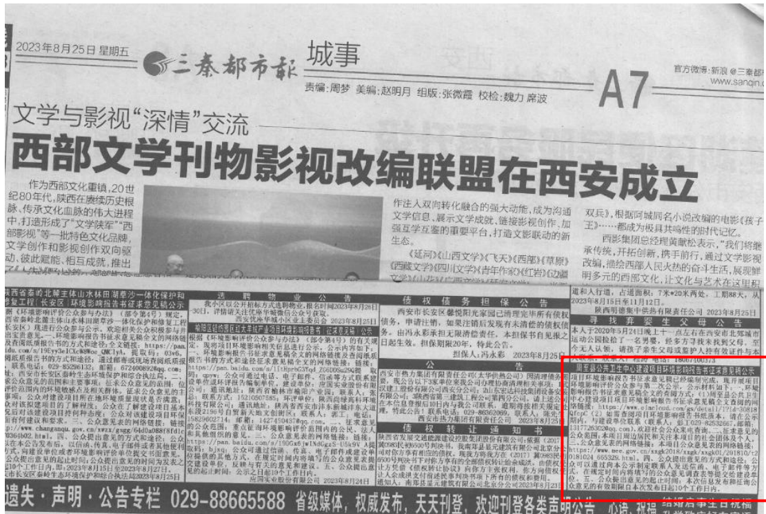
图3 征求意见稿公示（报纸第一次）