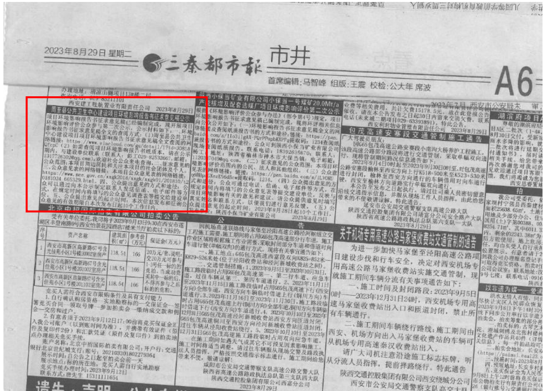
图4 征求意见稿公示（报纸第二次）