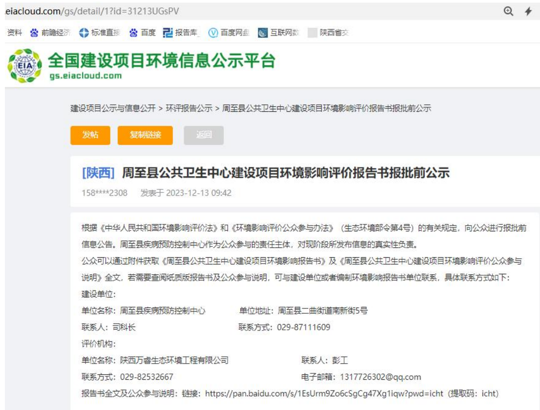
图 5 第三次网络平台公示