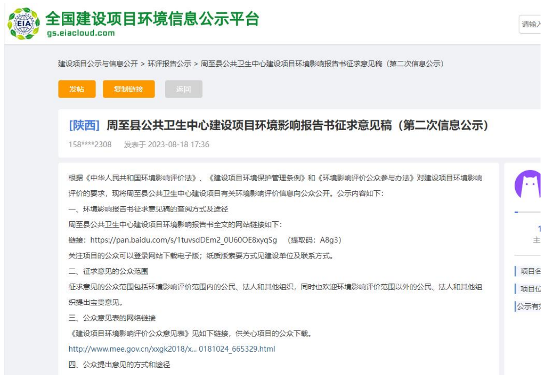
图2 征求意见稿公示（网络平台）