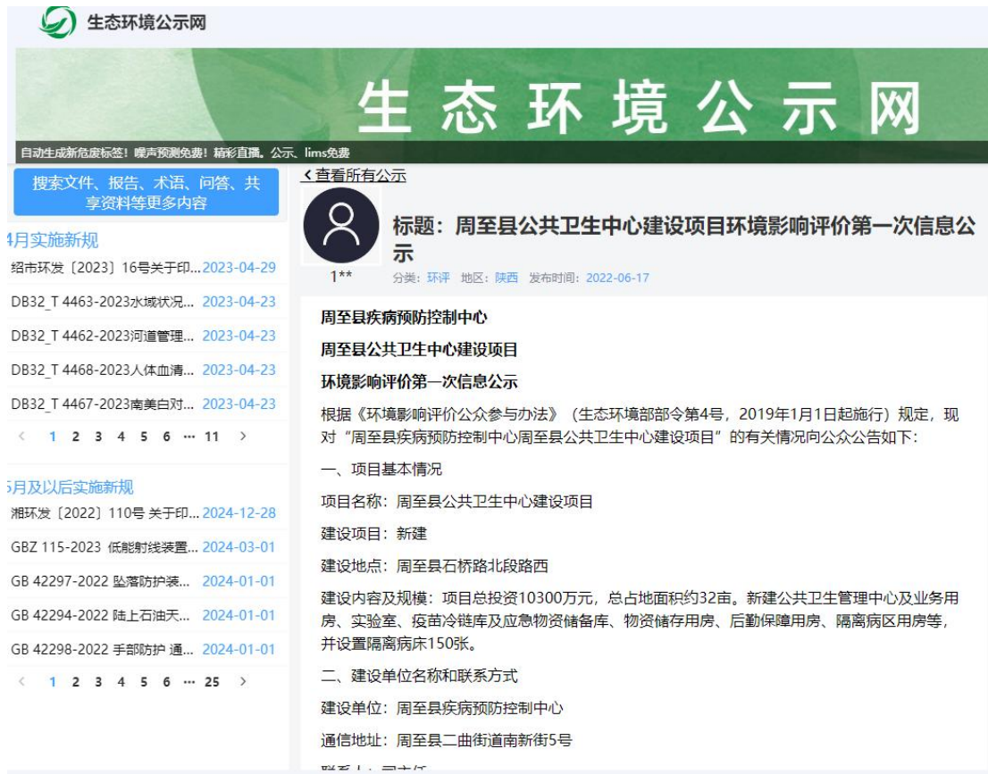
图1 第一次网络平台公示

3、公示网址： https://gongshi.qsyhbgj.com/h5public-detail?id=294138 。公示截图见图1。