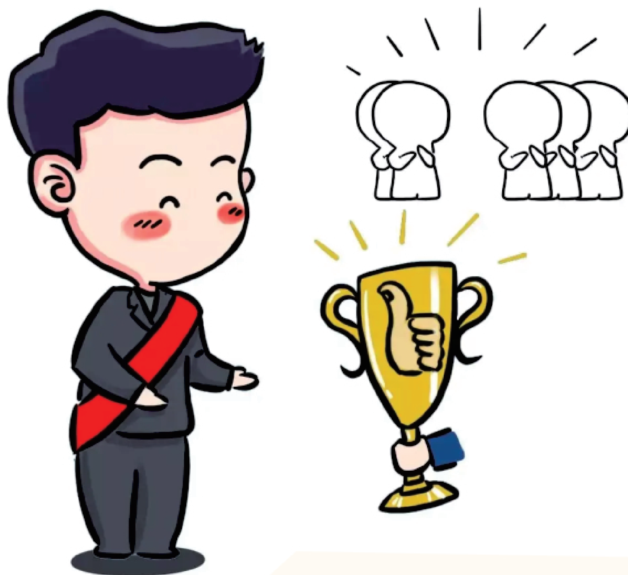
作出突出成绩和贡献

2.对在信访工作中作出突出成绩和贡献的机关、单位或者个人，可以按照有关规定给予表彰和奖励。