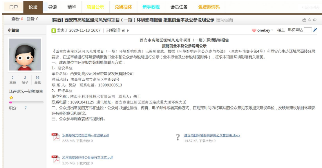
图 6-1 报批前公示截图

在环境影响报告书报送前，于 2020 年 11 月 13 日在环评互联网网站对报告书全本和公众参与说明进行了报批前公示，链接： https://www.eiabbs.net/thread-371549-1-1.html 。截图如下：