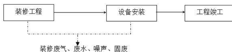
图1 施工期生产工艺流程及产污环节图